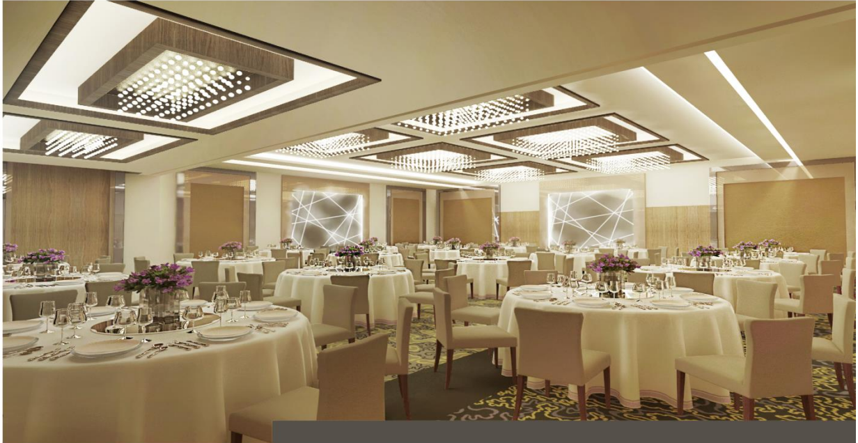
GOLDEN TULIP BAHRAIN BALLROOM